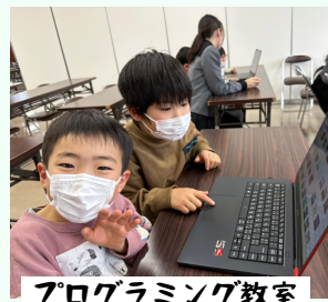
プログラミング教室