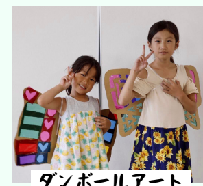
ダンボールアート