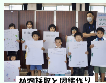
植物採取と図鑑作り