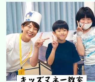
キッズマネー教室